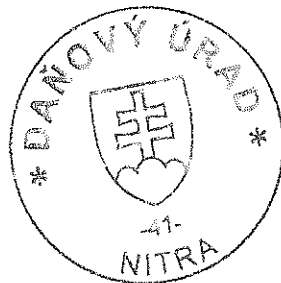
Ing. Eva Klíčová vedúci oddelenia správy daní 4

Toto oznámenie sa vyvesuje po dobu 15 dní. Podľa § 35 ods. 2 zákona č. 563/2009 Z. z. v znení neskorších predpisov posledný deň tejto lehoty sa považuje za deň doručenia.