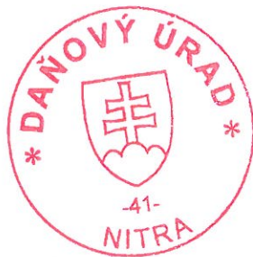
Ing. Eva Klíčová vedúci oddelenia správy daní 4

Toto oznámenie sa vyvesuje po dobu 15 dní. Podľa § 35 ods. 2 zákona č. 563/2009 Z. z. v znení neskorších predpisov posledný deň tejto lehoty sa považuje za deň doručenia.