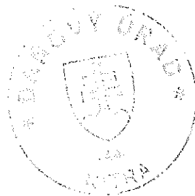
Ing. Eva Klíčová vedúca oddelenia správy daní 4

Toto oznámenie sa vyvesuje po dobu 15 dní. Podľa § 35 ods. 2 zákona č. 563/2009 Z. z. v znení neskorších predpisov posledný deň tejto lehoty sa považuje za deň doručenia.